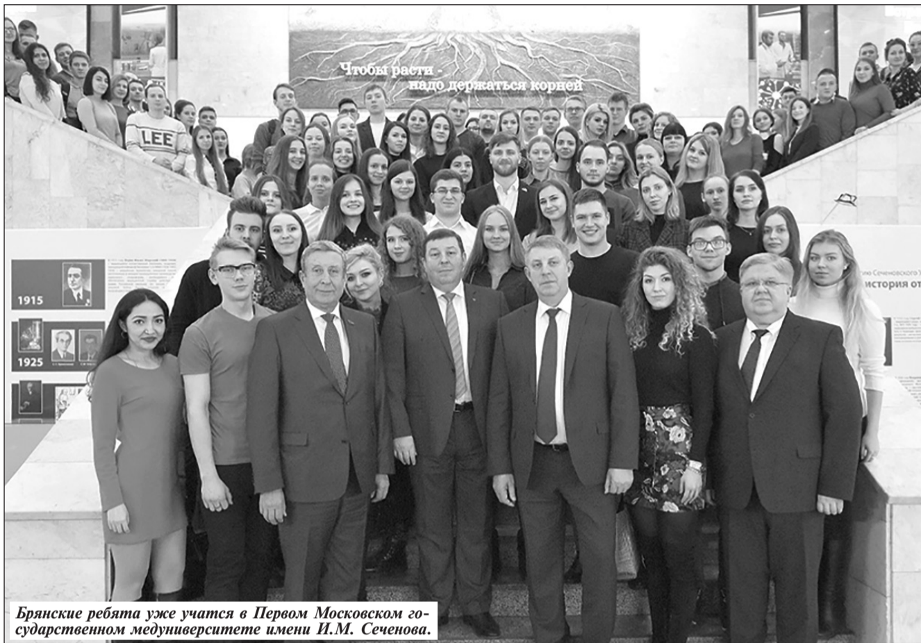
Брянские ребята уже учатся в Первом Московском государственном медицинском университете имени И.М. Сеченова.