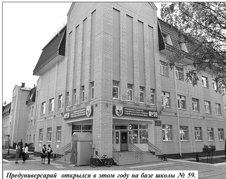
Предуниверсарий открылся в этом году на базе школы № 59.

Национальный проект «Здравоохранение» реализуют с 1 января этого года. Ему уделяют особое внимание в нашей стране и на Брянщине, в частности. #нацпроектздоровоохранение