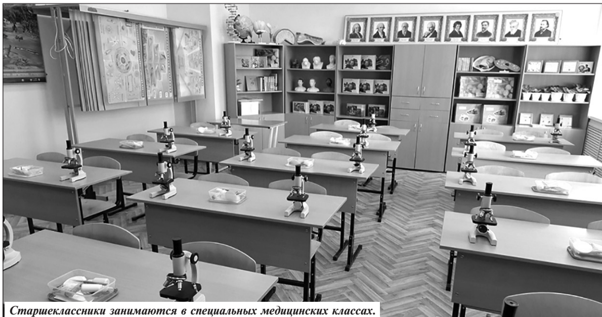
Старшеклассники занимаются в специальных медицинских классах.